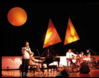
25.11.09 | Foto: Birgit Caspari