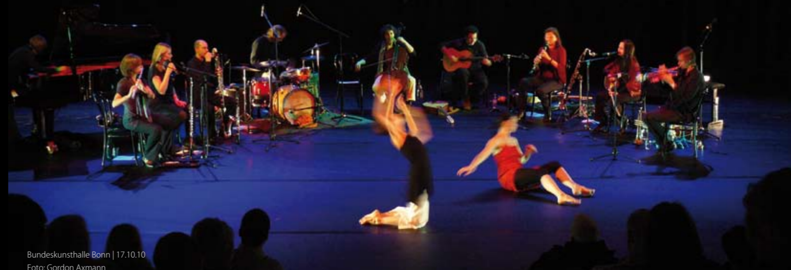
Bundeskunsthalle Bonn | 17.10.10