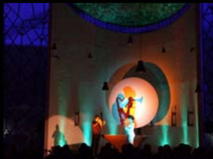
Hürth Kalscheuren | 28.01.2008 St. Ursula | Böhm Chapel ehem. Pfarrkirche; heute Galerie